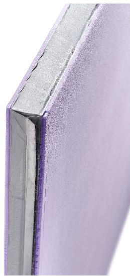
va-Q-vip F GGM